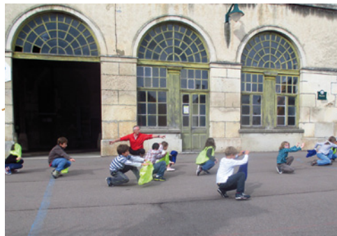
NAP : Nouvelles activités pédagogiques

La rentrée scolaire a vu la mise en place de la réforme des rythmes éducatifs. Après un temps de concertation avec les représentants de parents, les enseignants, les élus du RPI et de la communauté de commune, l'organisation du temps a évolué :