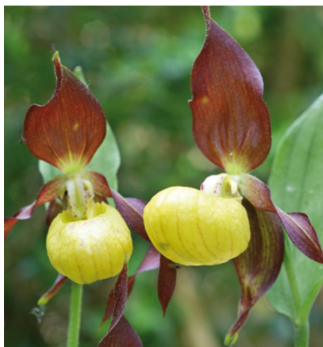
Sabot de Vénus